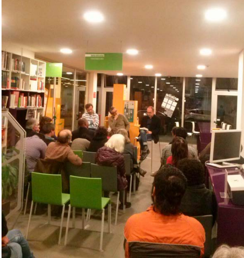
Archivo de imagen del Consejo Puebla de Lectura

En lo referente a los procesos lectores, aun cuando son escasos los estudios que ponen de manifiesto la relevancia de su enseñanza en la formación de investigadores, estos presentan resultados y argumentos cardinales que fundamentan su pertinencia (Kwan, 2008; 2009; McAlpine, 2012). En lo referente a las dificultades que la investigación ha identificado en los procesos lectores durante la formación doctoral se encuentra, de acuerdo con Kwan (2009), la complejidad implicada en la selección de la bibliografía, la lectura intertextual y la elección de las citas pertinentes. Hacer frente a estas dificultades requiere que el estudiante conozca la investigación específica de la comunidad disciplinar a la que su trabajo pertenece o se extiende, así como el paradigma que esta sigue, en caso de que existan múltiples paradigmas, y con ello quiénes son citados y leídos como parte de este, así como los trabajos que no son citados dentro del mismo.