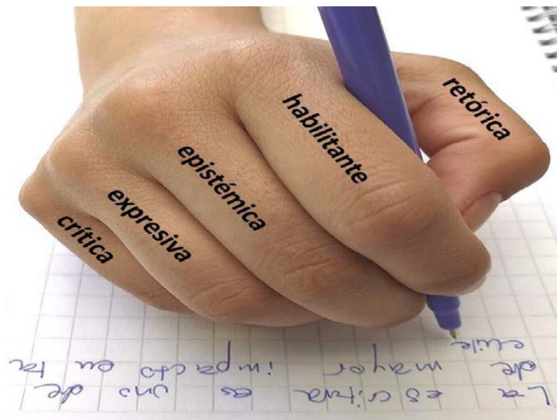
Figura 3. Cinco funciones simultáneas de la escritura en educación superior.

A partir de esta propuesta, las iniciativas de enseñanza no deberían apuntar a solo una de estas funciones. Puesto que se manifiestan de manera simultánea, al pretender focalizar solo en una, se puede desatender e incluso perjudicar las otras funciones. Cuando un profesor llena de correcciones de "forma" el texto de un estudiante, no está incidiendo solo sobre la función retórica y habilitante, sino que también está reduciendo las posibilidades de que ese estudiante se empodere, se construya y se autoperciba como escritor universitario cuyas ideas y perspectivas creativas merecen ser tomadas en cuenta. Al contrario, cuando el mismo profesor decide no corregir la "forma" y poner el foco en el aprendizaje de