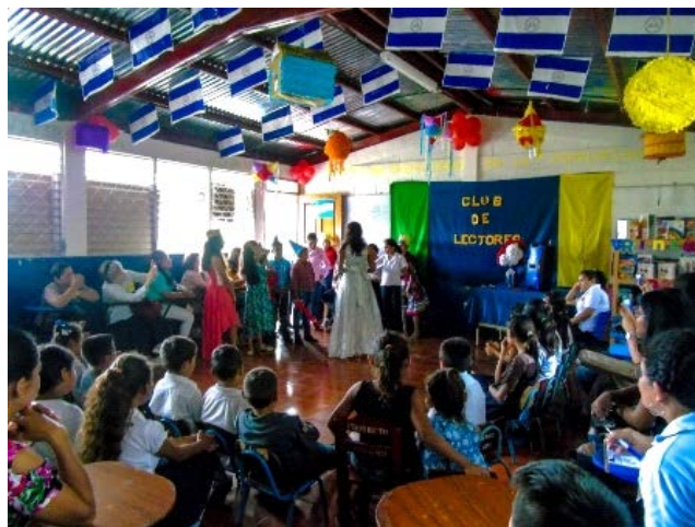
Festival de lectura en el que hubo teatro organizado por los estudiantes

En los rincones se colocan cojines, sillas o mantas para que los niños se sienten o acuesten y puedan leer con comodidad. Además, los participantes seleccionan el libro que desean leer. En palabras de una promotora: