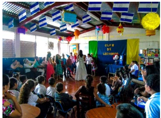
Festival de lectura en el que hubo teatro organizado por los estudiantes

En los rincones se colocan cojines, sillas o mantas para que los niños se sienten o acuesten y puedan leer con comodidad. Además, los participantes seleccionan el libro que desean leer. En palabras de una promotora: