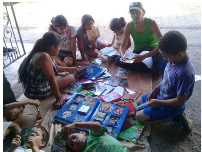
Círculo lector funcionando frente a una casa en la calle con apoyo de un promotor voluntario

La promoción de la lectura, sin embargo, no es solamente realizada por los promotores. En esa labor se ha incorporado también a la familia y la comunidad. Para ello en los círculos se utilizan técnicas y dinámicas lúdicas que han sido enseñadas en talleres diversos organizados por IPADE. Los círculos de lectura, por tanto, juegan el rol de motivar a todos (niños, padres, docentes), a amar la lectura. En los círculos se usa literatura infantil donada por IPADE/SC y la campaña "Vamos a leer", que se ubica en rincones de cuentos. Los círculos de lectura de cuentos funcionan en áreas físicas acondicionadas con mobiliario confortable e idóneo para la lectura, algunos están dentro de las escuelas, otros en casas comunales y otros funcionan en condiciones precarias, una acera si es necesario.